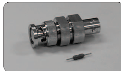
► Адаптер плавкого предохранителя BNC и плавкий предохранитель 0,125 А.

Кабель GPIB, с двойным экранированием – 012-0991-00.