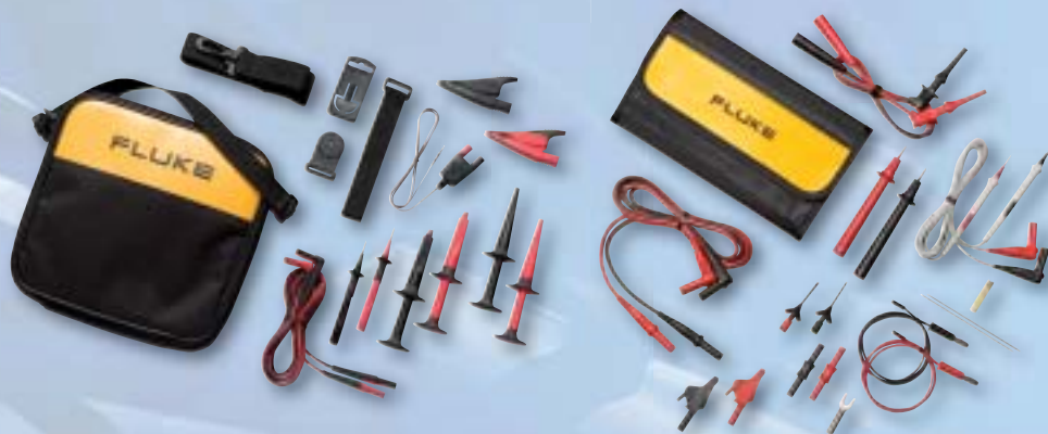
TLK289 Комплект измерительных проводов

Для повышения производительности приборов Fluke 289 и Fluke 287 имеется широкий выбор дополнительных аксессуаров, но следующие принадлежности важны для большинства пользователей.