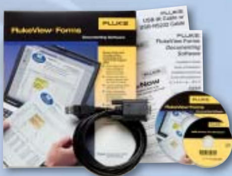
FlukeView® Forms Кабель и программное обеспечение