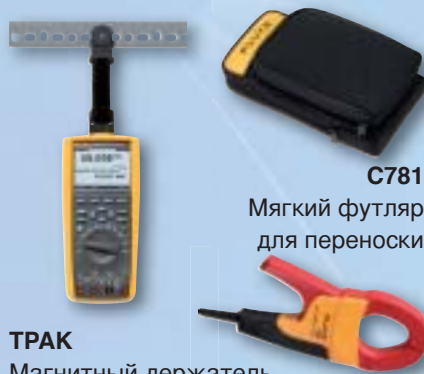
C781 Мягкий футляр для переноски